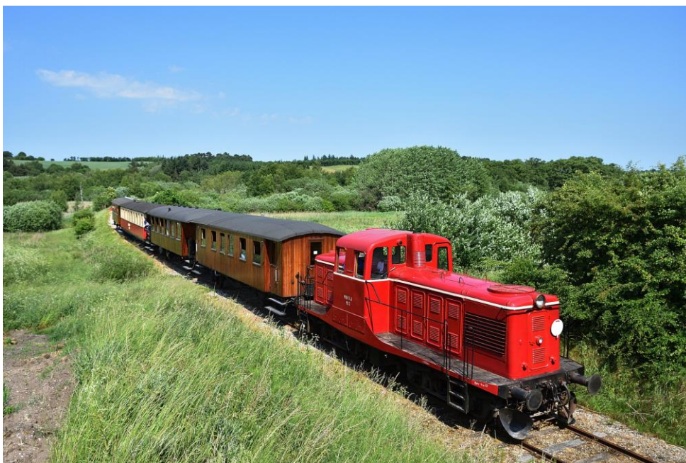
Diesellokomotivet M5, der nu erstatter damtogene på veteranbanen

Diesellokomotivet litereret M5 , og er bygget i 1953 hos Frichs i Århus. Det 68 år gamle dieselelektriske køretøj blev leveret til de daværende Horsens Vestbaner. Her fremførte lokomotivet banernes godstog frem til 1962, hvor banerne lukkede. Herefter drog lokomotivet mod nord, idet det solgtes til Thisted-Fjerritslev Jernbane. Syv år efter lukkede denne bane også, og lokomotivet fortsatte sin rejse videre nordover, hvor det nåede til Hirtshalsbanen.