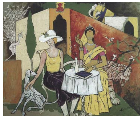
Maqbool Fida Husain. Fra Raj-serien, udateret