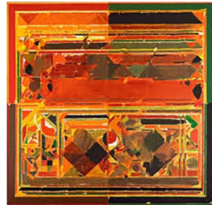
Sayed Haider Raza. Saurashtra, 2012