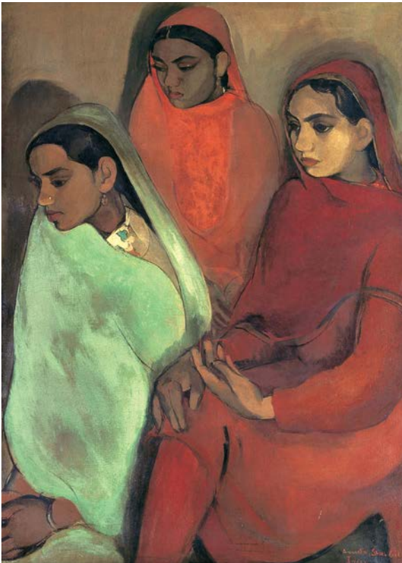
Amrita Sherghill. Tre piger, 1935

Efter Indiens selvstændighed i 1947 valgte mange indiske kunstnere at forenkles deres motivverden ved at dyrke apolitiske hverdagsmotiver. The Progressive Artists' Group (PAG) opstod i 1949 og blev en af de mest indflydelsesrige sammenslutninger i den indiske modernisme. Blandt dens medlemmer var fremragende kunstnere som S.H. Raza, M.F. Husain og F.N. Souza. S sammenslutningens kunstnere søgte nye udtryk til skildring af det postkoloniale Indien. Gruppen lagde derfor afstand til den revitalisering af oprindelig, indisk kunst, som Bengal School of Art stod for. De bød i stedet de europæiske avantgardestrømninger velkommen og indarbejdede træk fra den parisiske ekspressionisme i deres værker.