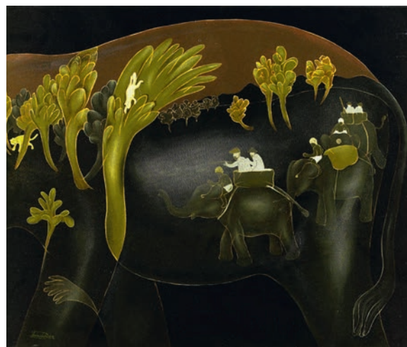
Debashis Sarkar. Jagt i det tidlige Indien I, 2007