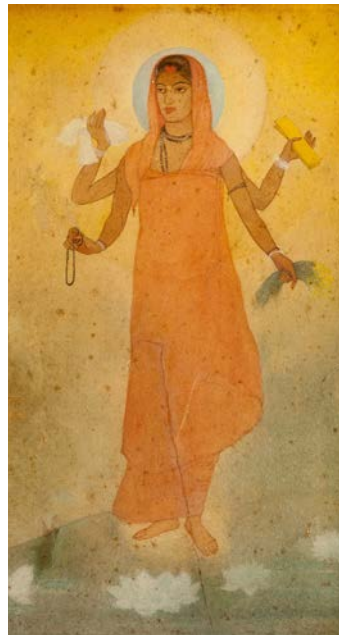
Abanindranath Tagore Bharat Mata, ca. 1905

Under stor indflydelse fra den indiske frihedsbevægelse forkastede kunstnere som Abanindranath Tagore og Nandalal Bose den vestlige, naturalistiske kunst og hentede i stedet inspiration i indisk mytologi og religion. For at imødegå den vestlige indflydelse, som under det britiske herredømme udgik fra akademierne, søgte Abanindranath Tagore at modernisere Mughal- og Rajput- stilarterne, som fra 1700- til 1900-tallet havde domineret det fyrstelige miniaturemaleri. Foregangs mændene i denne bevægelse danner kernen i det, der i dag er kendt som Bengal School of Art , hvorfra den indiske modernisme har sit udspring. Skolens kunstnere indarbejdede således træk fra både miniaturemaleri,