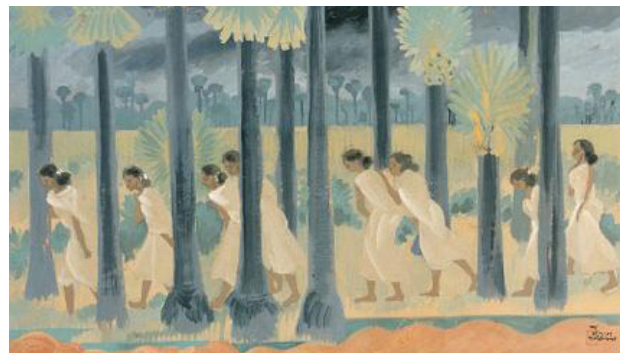
Nandalal Bose. Nye skyer, 1937

tempeludsmykninger og den omfattende billedverden i de nordvest-indiske Ajanta-huler i et modernistisk udtryk. Malerne Jamini Roys forenklede, folkloristiske udtryk og Amrita Shergils postimpressionistiske værker er fremtrædende eksempler på indisk modernisme.